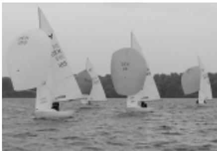
Tre Yngling og en Wayfarer på læns.

DANSKE BANK FURESØMESTERSKABERNE afholdes i 2006 med BS som arrangør lørdag d. 23 september, kl. 10:00. Præmieuddeling sker hos FAS søndag d. 8. efter årets sidste (torsdags)søndagsmatch.