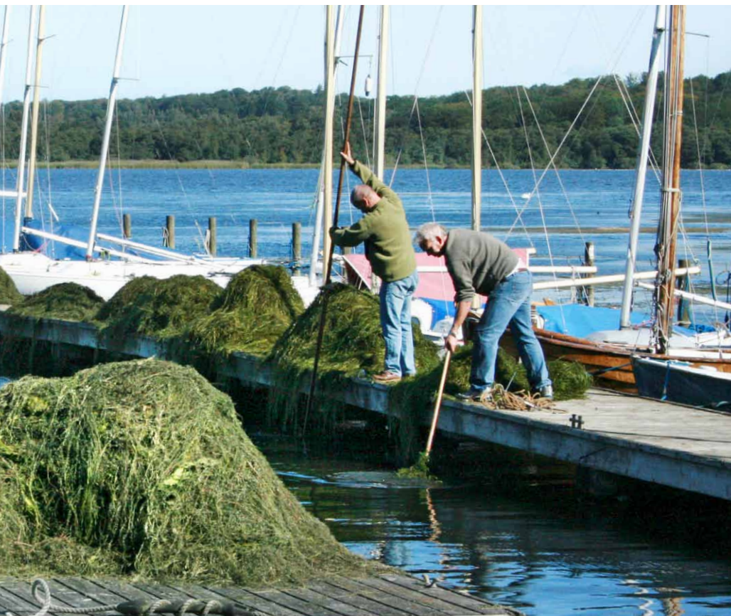
Uden denne indsats havde østbassinet ikke været så fremkommeligt i september – men fremover er det ikke velset at tage vandpesten op og lægge den over i skoven!

lidt fik vi da gjort, med det resultat at østbassinet var nogenlunde fremkommeligt det meste af eftersommeren. Jeg var selv et par gange med til at tage vandpest op af bassinet, men jeg må erkende at jeg blev ret betænkelig, da nogen pga. mangelfuld instruktion havde