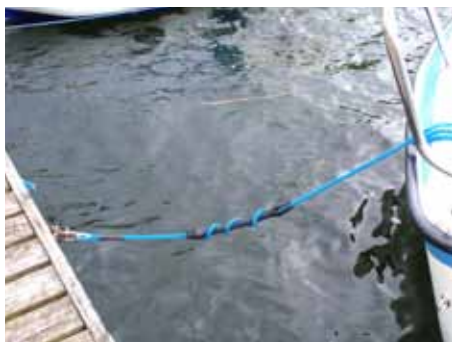
Fortøjning med "kødben".