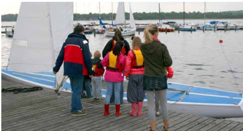
Åbent-hus arrangementet gennemføres i tæt samspil med Sejlerskolen.

I YF ønsker vi at fastholde og gerne udbygge vores Ungdomsafdeling. Derfor arbejder vi løbende på at få nye medlemmer. Et helt centralt element er vores årlige åbent-hus arrangement, som vi gennemfører i tæt samarbejde med Danske Bank i Holte. Rent praktisk gennemfører vi arrangementet over to hverdagsaftener, normalt i maj måned.