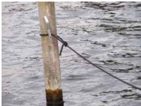
Fortøjning er sat for højt.