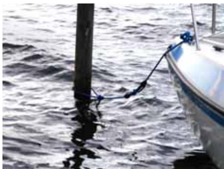
Fortøjning er sat korrekt.