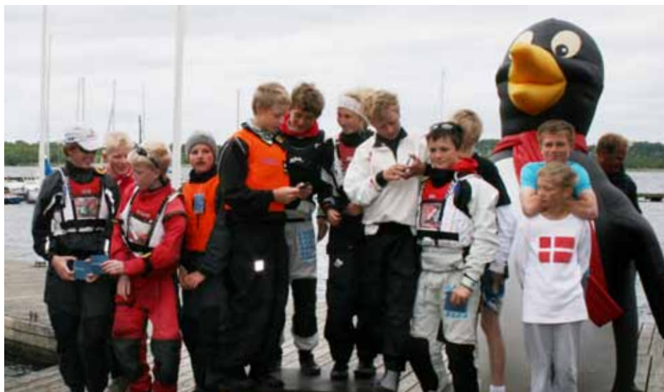
Danske Bank Furesø Cup blev holdt over 2 dage, her ses vinderne af holdsejladsen, som blev afviklet søndag. Vinderne var – ikke overraskende – et hold dannet af landsholdssejlere, som skal med til VM sidst på året.